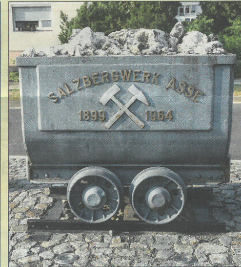
Überbleibsel aus dem Salzbergwerk.