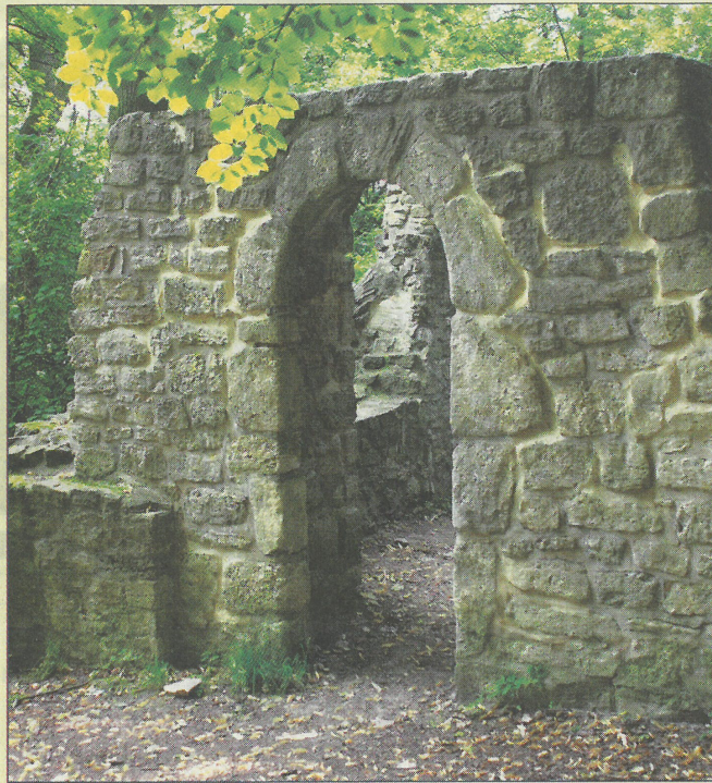
Eingang der Asseburg.