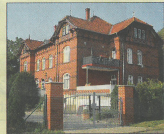
Villa zum Bismarckturm.