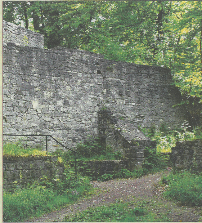
Ruine der Asseburg.